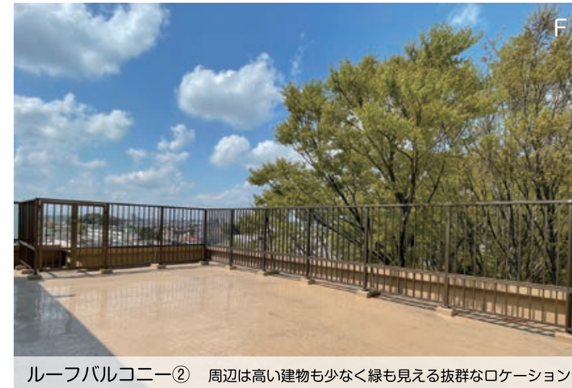
ルーフバルコニー② 周辺は高い建物も少なく緑も見える抜群なロケーション