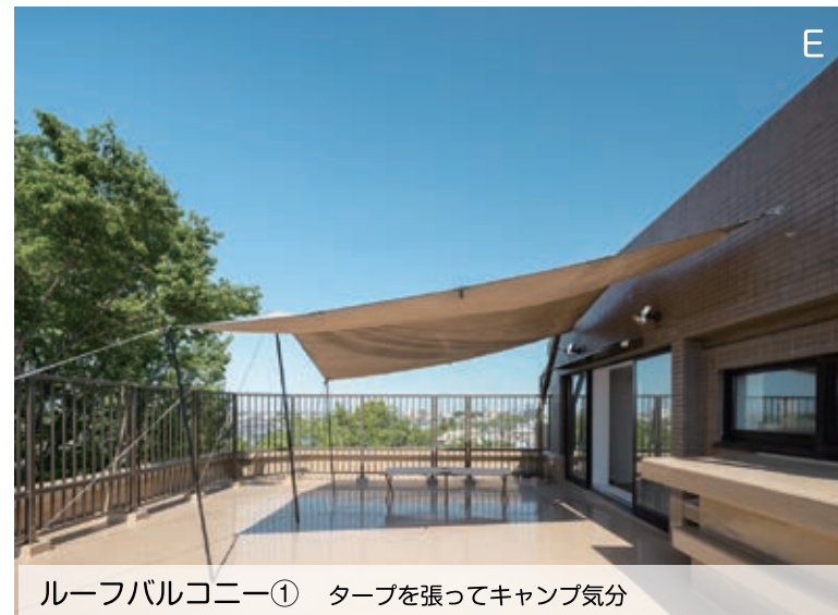
ルーフバルコニー① タープを張ってキャンプ気分