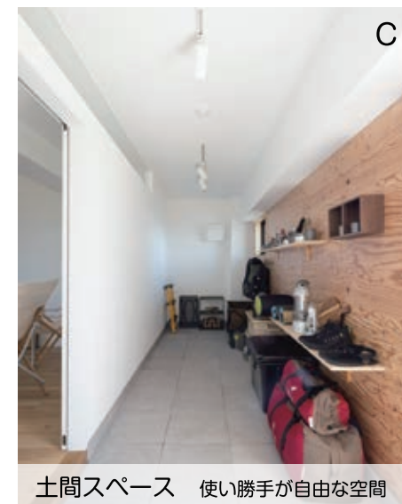
土間スペース 使い勝手が自由な空間