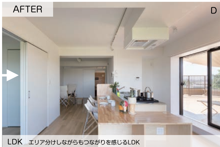
LDK エリア分けしながらもつながりを感じるLDK