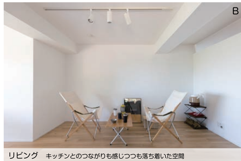
リビング キッチンとのつながりも感じつつも落ち着いた空間