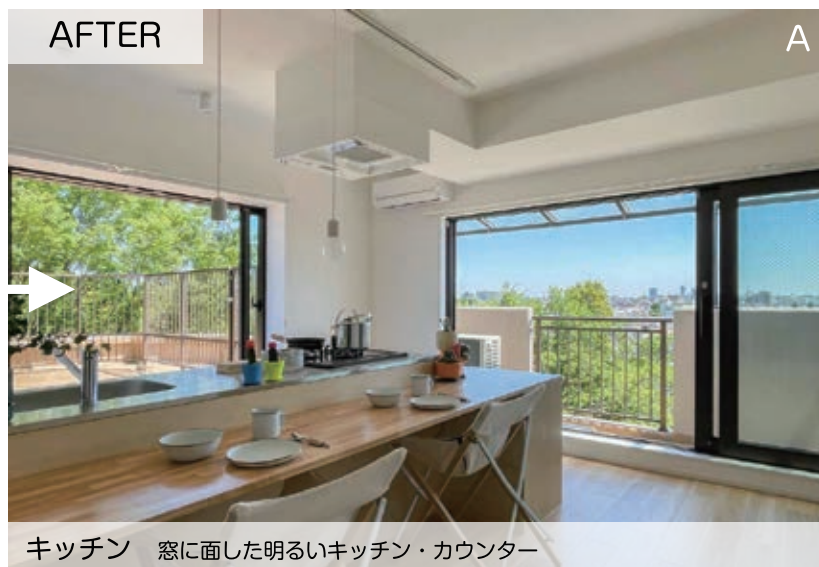
キッチン 窓に面した明るいキッチン・カウンター