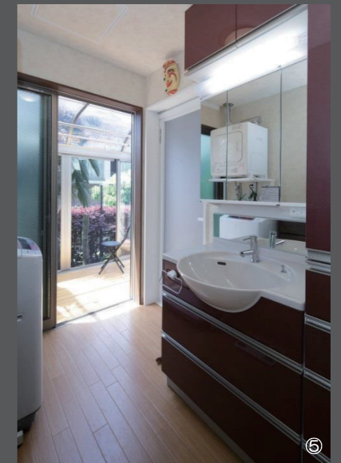
洗面所が南側になり、洗濯が楽しくなったそう。