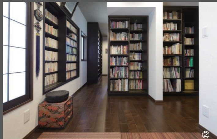
書棚をスライド式にすることで、大量に収納できるように。