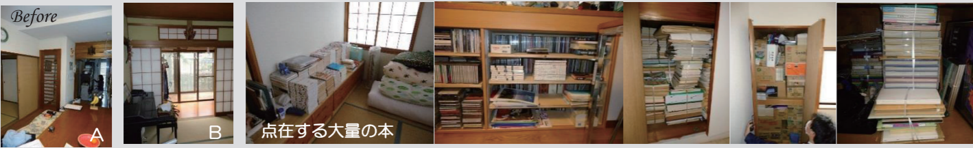
点在する大量の本