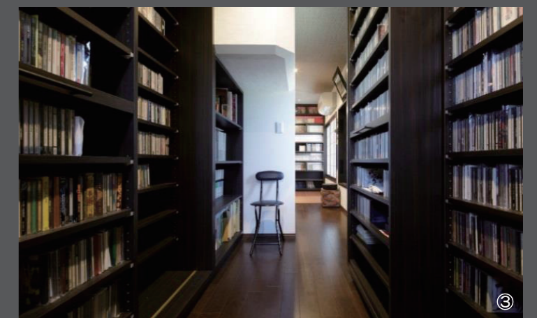
紫外線を防ぎ、断熱処理で結露をなくしたため蔵書が傷むことがない。