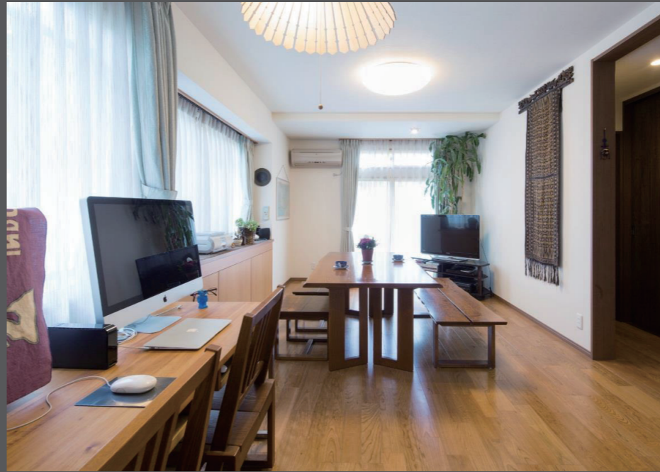
洗面・浴室へリビングから直接行けるプランとし、温度のバリアフリーを実現。