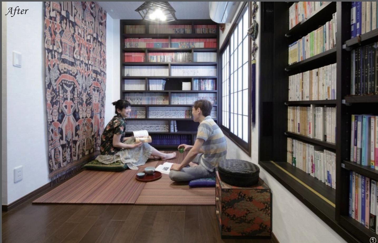
友人たちが集うとはじめはテーブルを囲むが、「次は書庫で呑みたい!」と皆ここへ移動する。紙筆等の中にはお猪口とお酒のつまみが入っている。