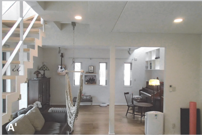
A' おしゃれな空間ではあるが、少し暗かった既存のリビング。