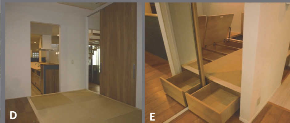
D ゲストルームに造作家具で製作した下部収納つき畳コーナー。すっきりしたデザインで大容量の収納を実現。ご主人の趣味のための防音室。