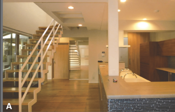
A ストリップ階段に向かい合うように大きなキッチンを配置。