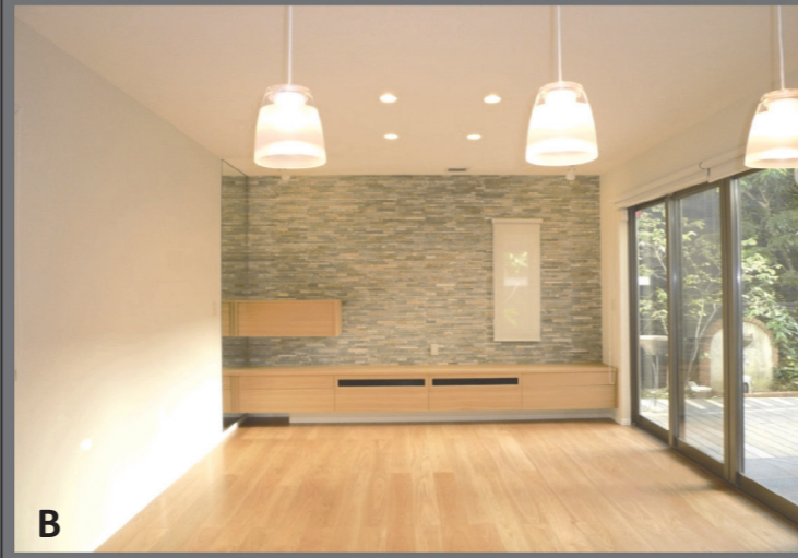
B タイルでアクセントをつけたリビング。レイアウト変更により日当たりが劇的に改善。