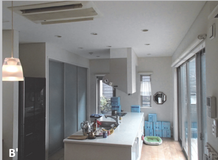
B' 最も日当たりのよい場所にあった既存のキッチン。