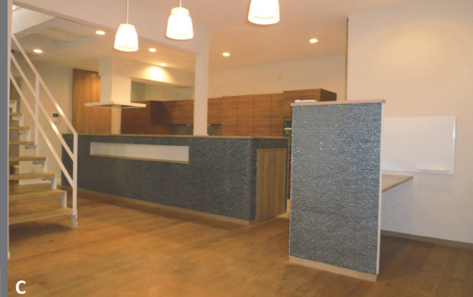
C 奥様が毎日楽しく快適にお料理ができるよう、デザイン性の高いキッチンを中心に、右はPCコーナー。