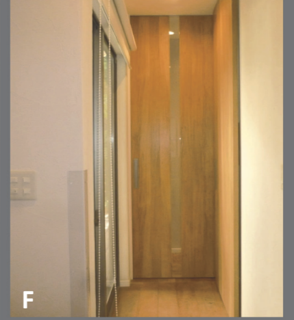
F 玄関からLDKへつながる廊下。