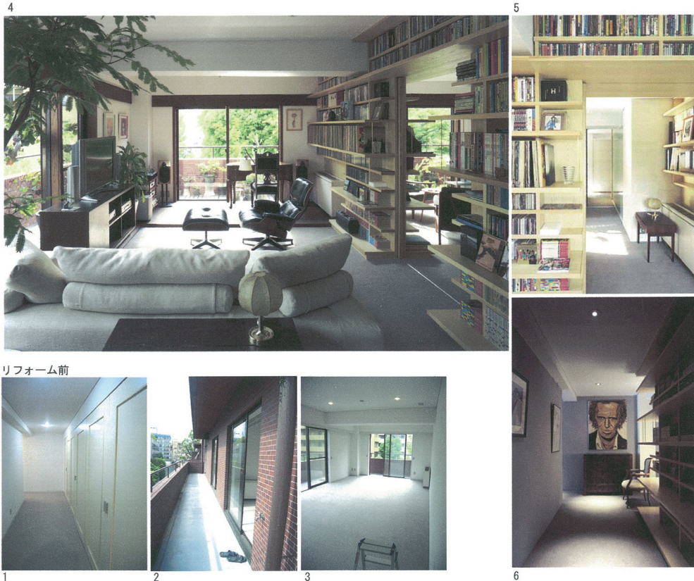
リフォーム前後の写真

「ジャングルのような」とは面白いキーワード。気楽でありながらうまく住み続けられるという、リフォームの根本的な視点を言い当てているようである。最低限の整理は必要だが、本件は「ジャングルのように美しい」。