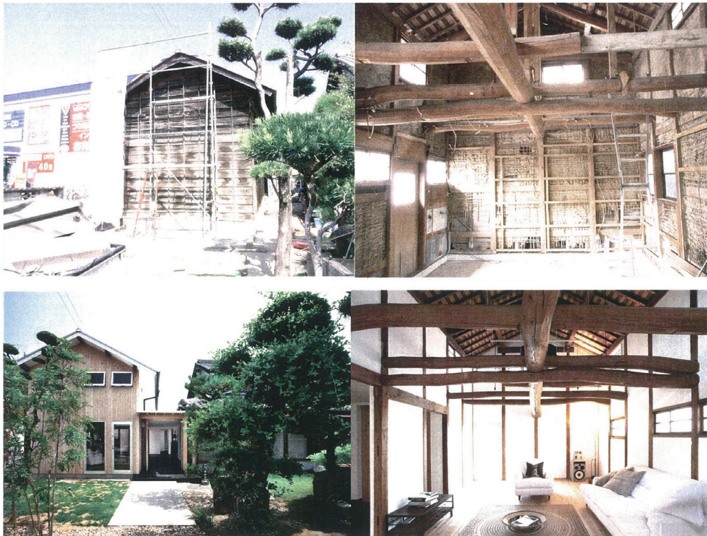
リフォーム前後の写真

牛舎のリフォームとは面白い。内壁の素朴さの表現だけでなく、L字型のアトリウムのストープ回りには座ってみたくなる魅力がある。プランも牛舎の面影を残しているようで、設計者の自邸らしい遊び心が感じられる。