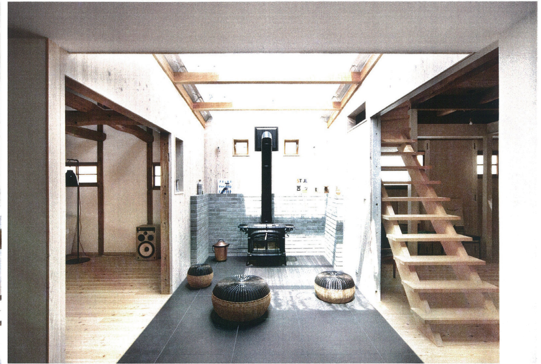
リフォームの動機/設計・施工の工夫点/施主の感想・満足度/特筆すべき住宅性能向上の内容など