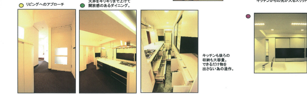
リビングへのアプローチ キッチンも後ろの収納も大容量。できるだけ物を出さない為の造作。