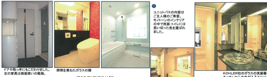
ドアや取っ手にもこだわりました。左の家具は両面使いの鏡箱。 照明を兼ねたガラスの棚 ユニットバスの内窓はご主人様のご希望。モトーンの内窓インテリアの中で洗面トイレには思い切った色を選びました。 天井をギリギリまで上げて開放感のあるダイニング。 KOHLER社のガラスの洗面器 キッチンからの光が入るスリット窓