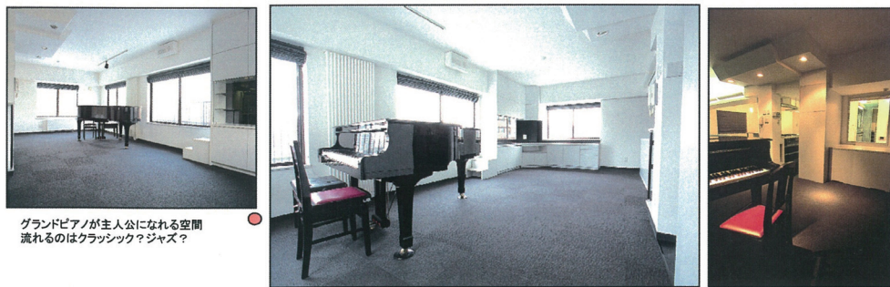
グランドピアノが主人公になれる空間流れるのはクラシック？ジャズ？