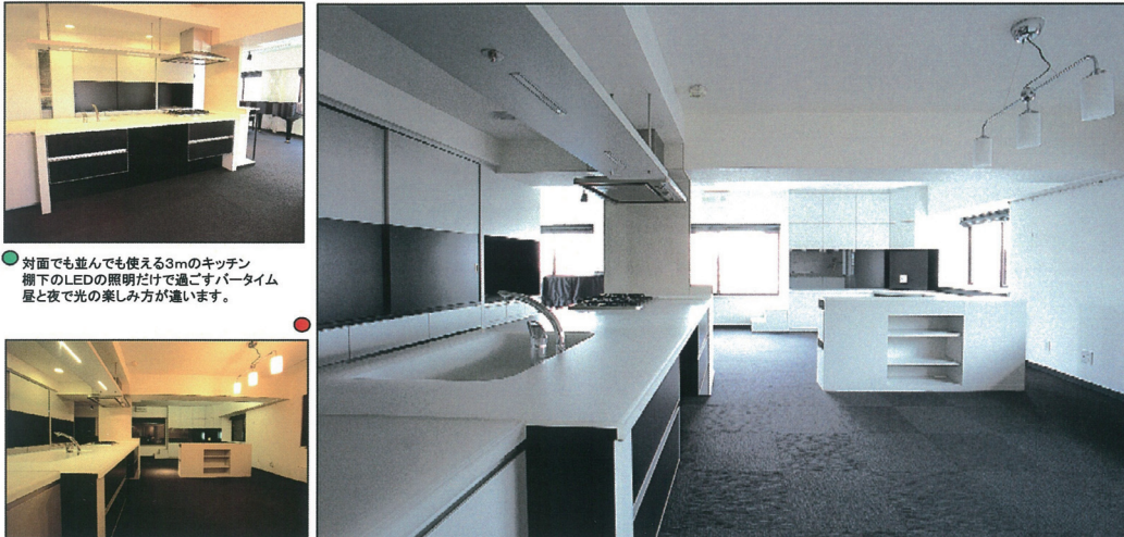
対面でも並んでも使える3mのキッチン棚下のLEDの照明だけで過ごすパーティタイム昼と夜で光の楽しみ方が違います。