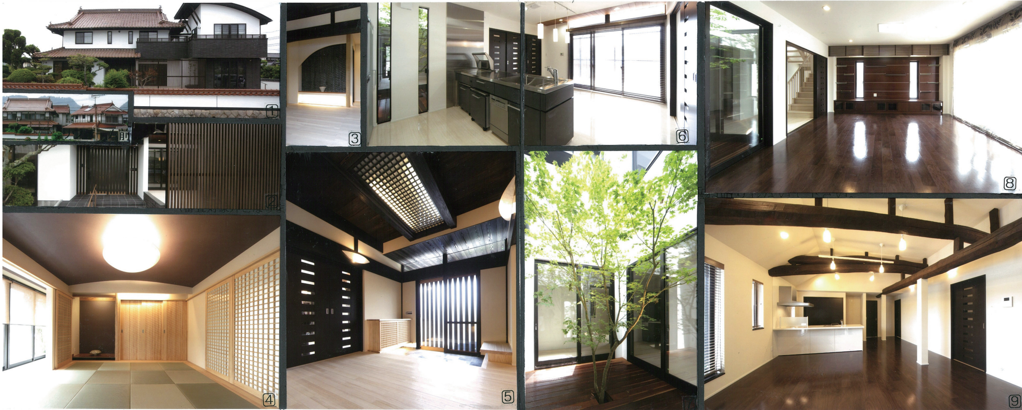
リフォームの動機/設計・施工の工夫点/施主の感想・満足度/特筆すべき住宅性能向上の内容など

敷地が区画整理事業に1部かかり、納屋の解体を余儀なくされた。母屋だけで60坪近くあったが、三世帯の構えが必要となり、新たに38坪の増築を施し、十分な広さを確保した。建替えも検討されていたが、築80年の母屋を現代風の増築部（アール屋根）を融合させることで、代々続く「家」の面影を残しつつ、新しい世代への架け橋としての新しい表情を与えた。母屋は、いわゆる古民家としての特徴の差鴨居を柱と梁で構成されており、グリッドをうまく利用してそれぞれの表情を取り入れ、全く新しい間取りを構築した。