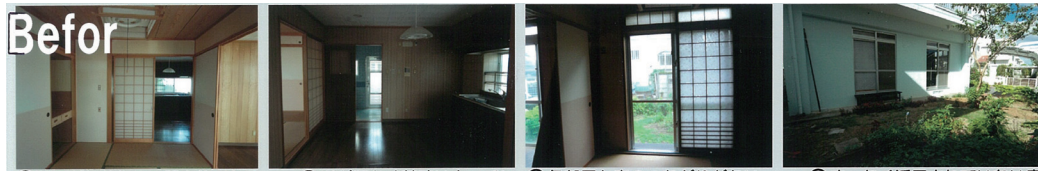
④部屋が細分化して閉塞的である ⑤光が届かず薄暗いキッチン ⑥各部屋と庭のつながりがない ⑦まったく活用されていない庭