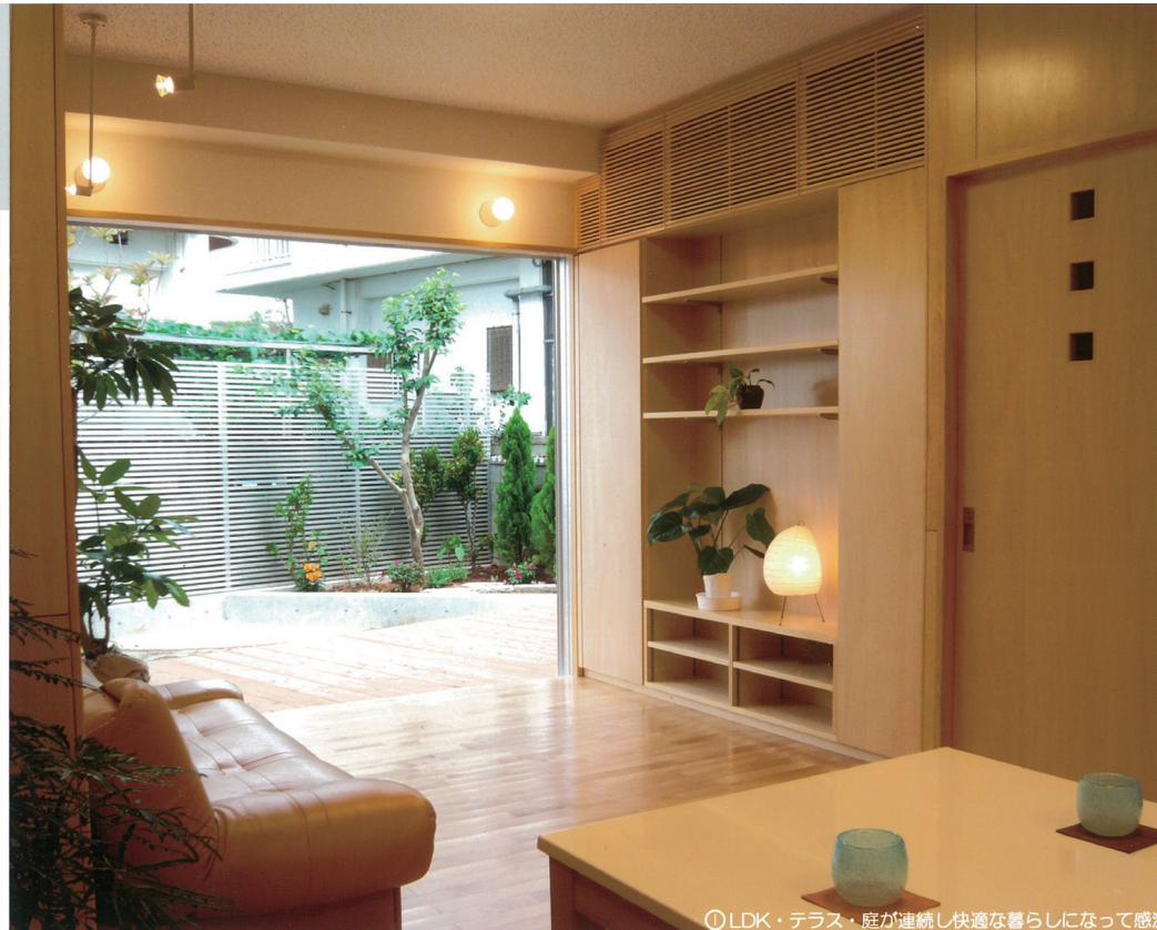
⑫LDK・テラス・庭が連続し快適な暮らしになって感激

リフォームの動機／設計・施工の工夫点／施主の感想・満足度／特筆すべき住宅性能向上の内容など