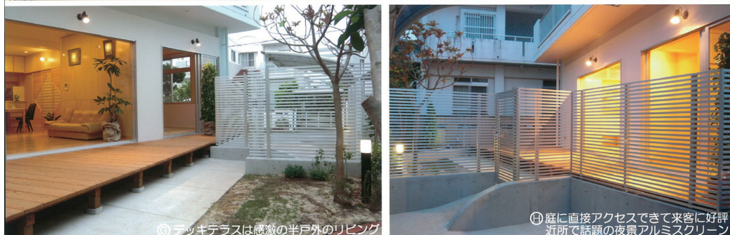
⑩デッキテラスは感激の半戸外のリビング ⑪庭に直接アクセスできて来客に好評。近所で話題の夜景アルミスクリーン