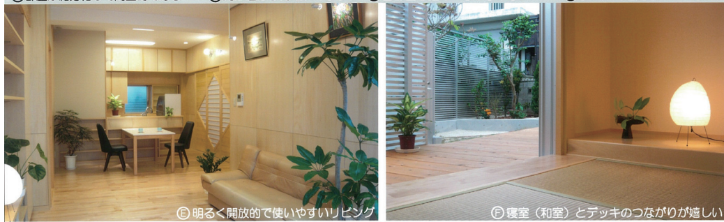
⑧明るく開放的で使いやすいリビング ⑨寝室（和室）とデッキのつながりが嬉しい