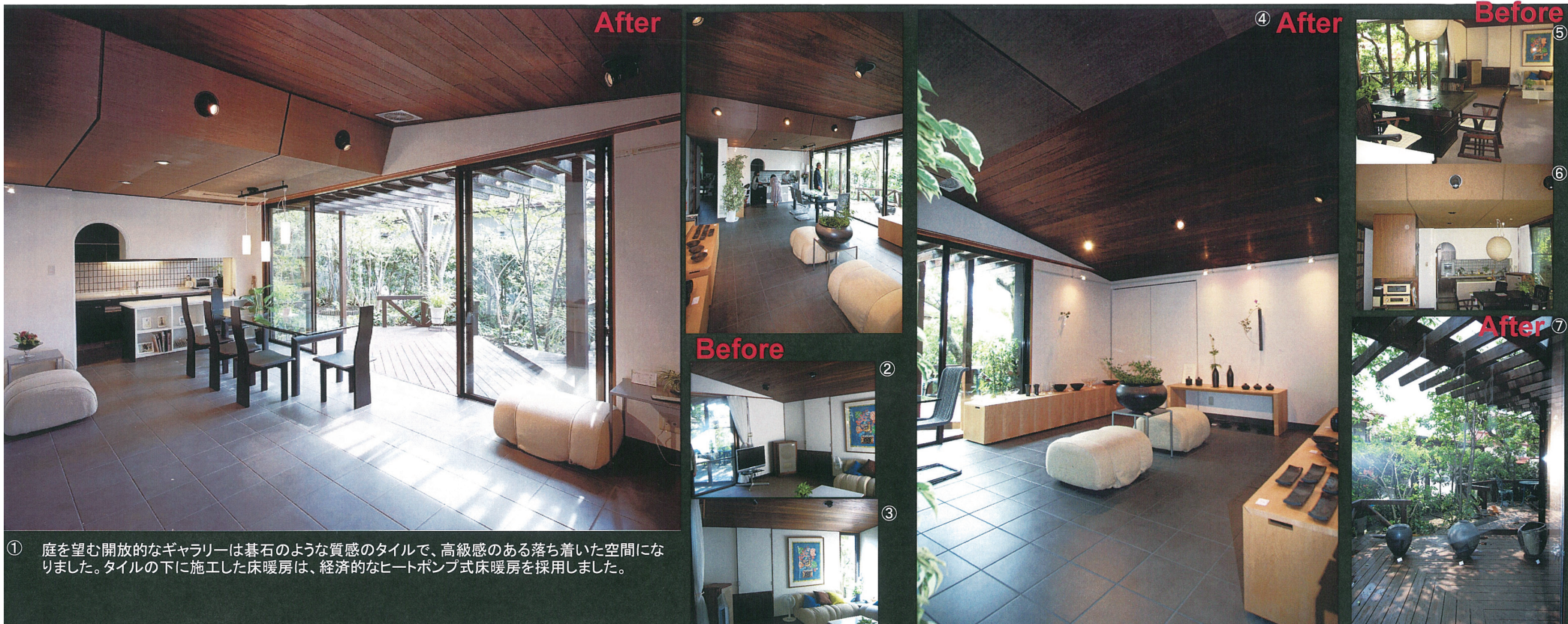
① 庭を望む開放的なギャラリーは基石のような質感のタイルで、高級感のある落ち着いた空間になりました。タイルの下に施工した床暖房は、経済的なヒートポンプ式床暖房を採用しました。

リフォームの動機/設計・施工の工夫点/施主の感想・満足度/特筆すべき住宅性能向上の内容など