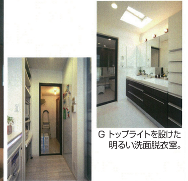
F キッチンからパントリーを見る。 右壁面はスチールボードを貼ったマグネットウォール。