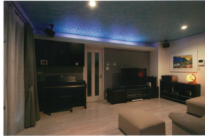
E (夜のリビング) 天井に蓄光クロスを貼ったリビング。水面下にいるイメージ。