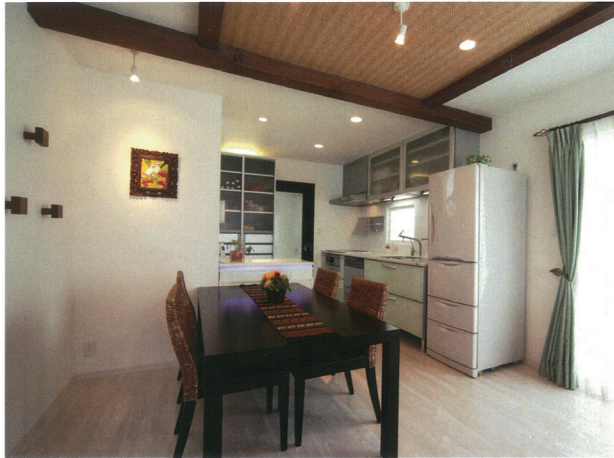
A 施主のお気に入りのキッチンにアジアテイストをコーディネート。