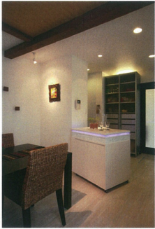
D LED内蔵の可動式キッチンワゴン。