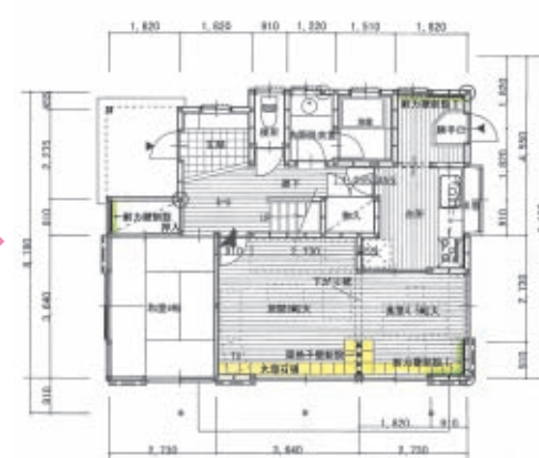
壁配置バランス改修後・平面図