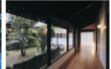
玄関に入って右側が洋室、左側に庭を見て吹きさらしの渡り廊下へと進む。