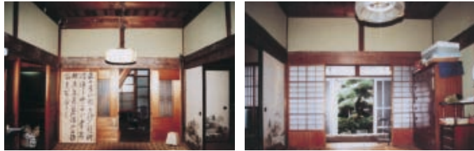
リフォーム前の和室6帖を南面より見る。 リフォーム前の和室6帖を北面より見る。