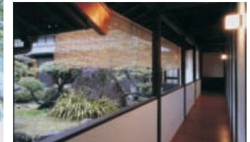
吹きさらしの渡り廊下、左に母屋が見える。