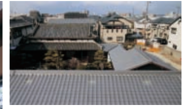
庭を囲むように、手前が門屋、右に吹きさらしの渡り廊下、奥が母屋。