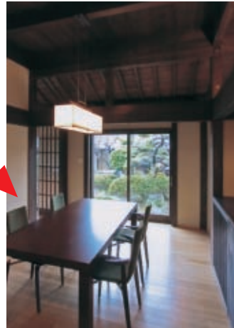
庭を眺めながらの食事のできるダイニングルーム。