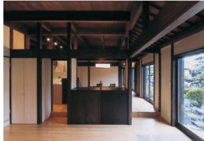
リフォーム前の玄関・ホール・洋室の壁を撤去し、リビングルームに。補強のために柱・差し鴨居等を新しく入れています。