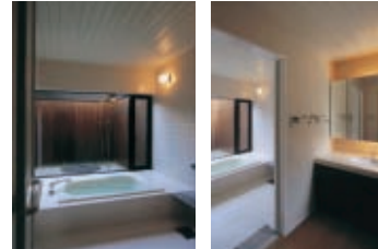
庭を眺めながらの浴室。 段差のない浴室入口回り。 リビングより門屋を見る。木製建具は全開できる。