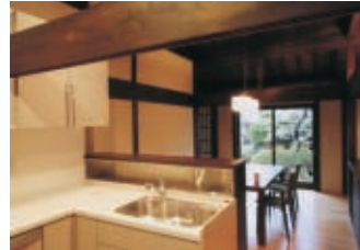
料理をしながら庭を眺めることができるキッチン。