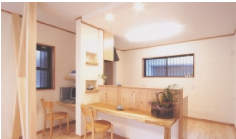
③ LDK 筋違を利用した自然素材のパソコンコーナーやカウンターが、LDKのポイントに。