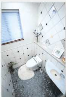
リフォーム後 C ↑