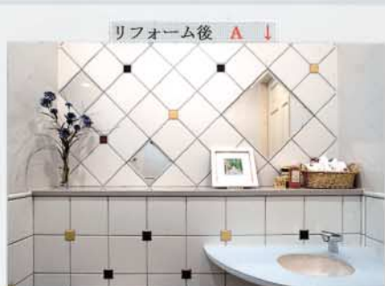
リフォーム後 ▲ ↓