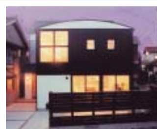
設計/(株)三谷設計 施工/渡辺建築