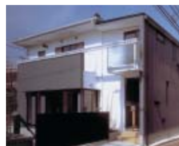
設計/(有)シーズ・アーキステディオ建築設計室 施工/(株)渡辺富工務店