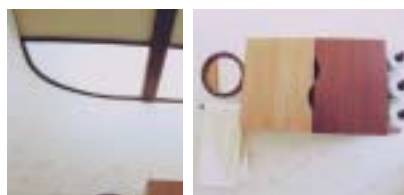
設計・施工/喜多ハウジング(株)