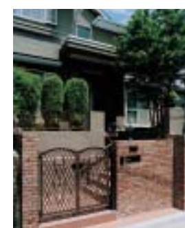
設計・施工/三井ホームリモデリング(株)