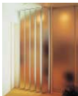
設計・施工/(株)東急アメニクス