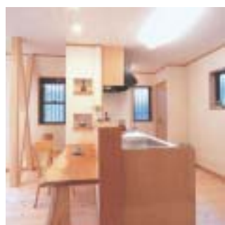
設計・施工/リファイン岡崎北