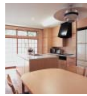
設計/マ architecture 施工/(有)代幸建設