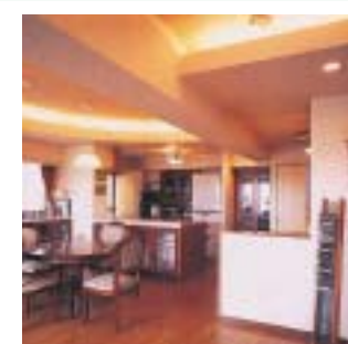
設計・施工/大京管理(株) [旧(株)ライオンズファミリー]