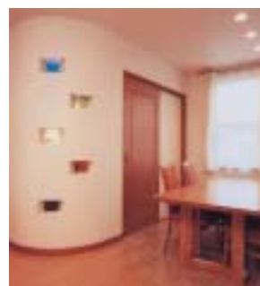
設計・施工/(株)ホームピア