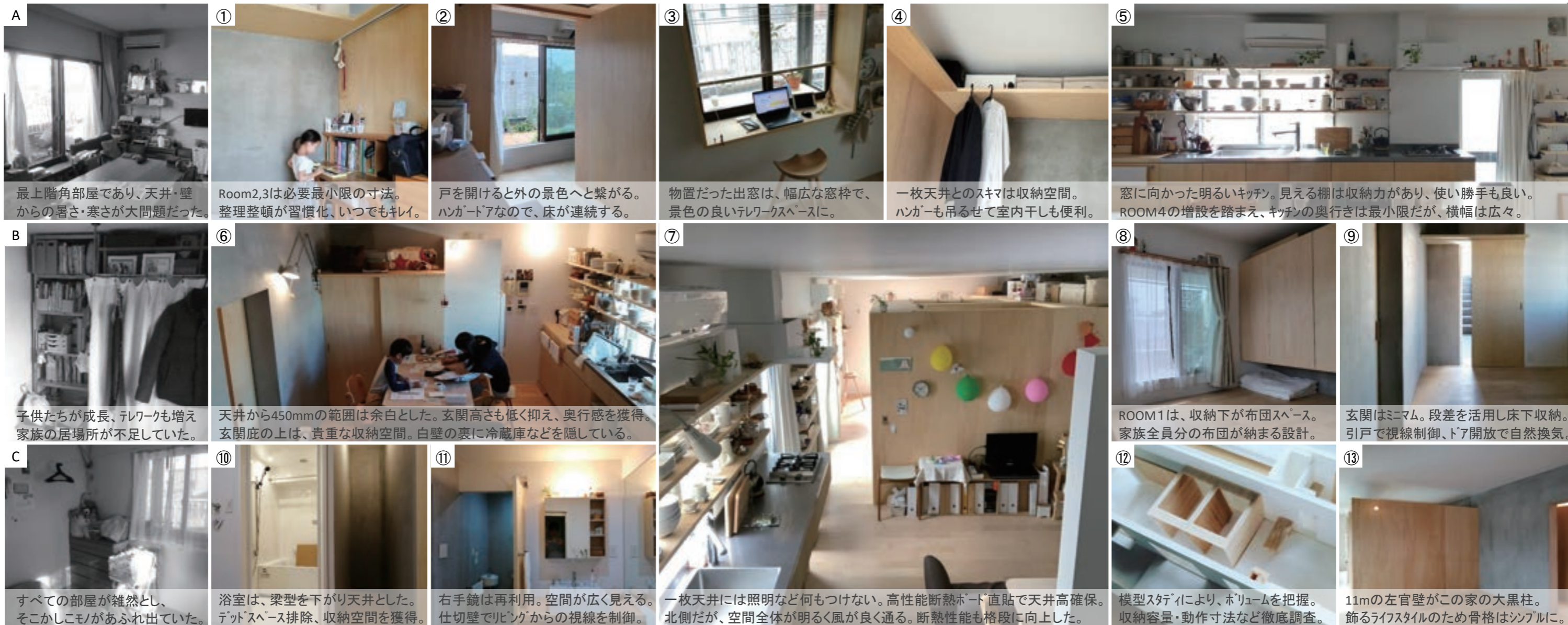
A 最上階角部屋であり、天井・壁からの暑さ・寒さが大問題だった。