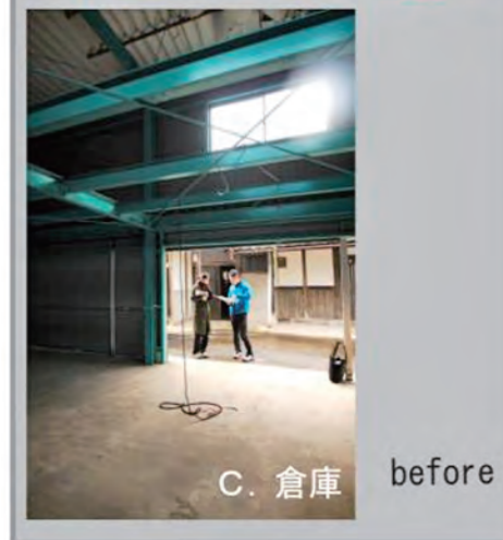
C. 倉庫 before