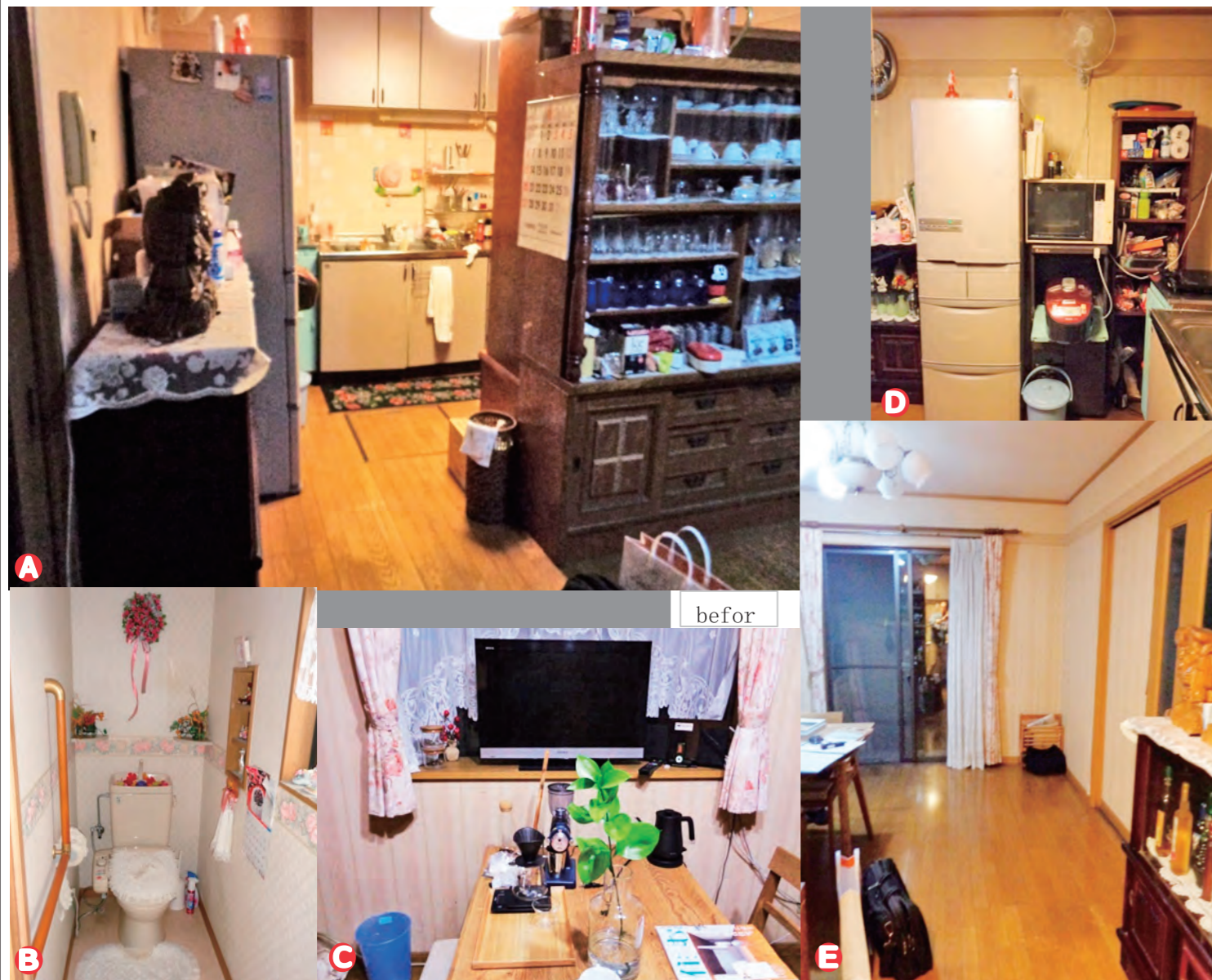
リフォーム前後の写真

二世帯同居の自宅で暮らすカフェ好きの独身青年、部屋のイメージは集めたインスタ画像で提示、と今風である。打合わせの結果、感度の高いカフェ部屋が完成し、友達を招く機会も増えたとか。リフォームは交友関係を円滑にし、人生に機会をもたらすという好例。