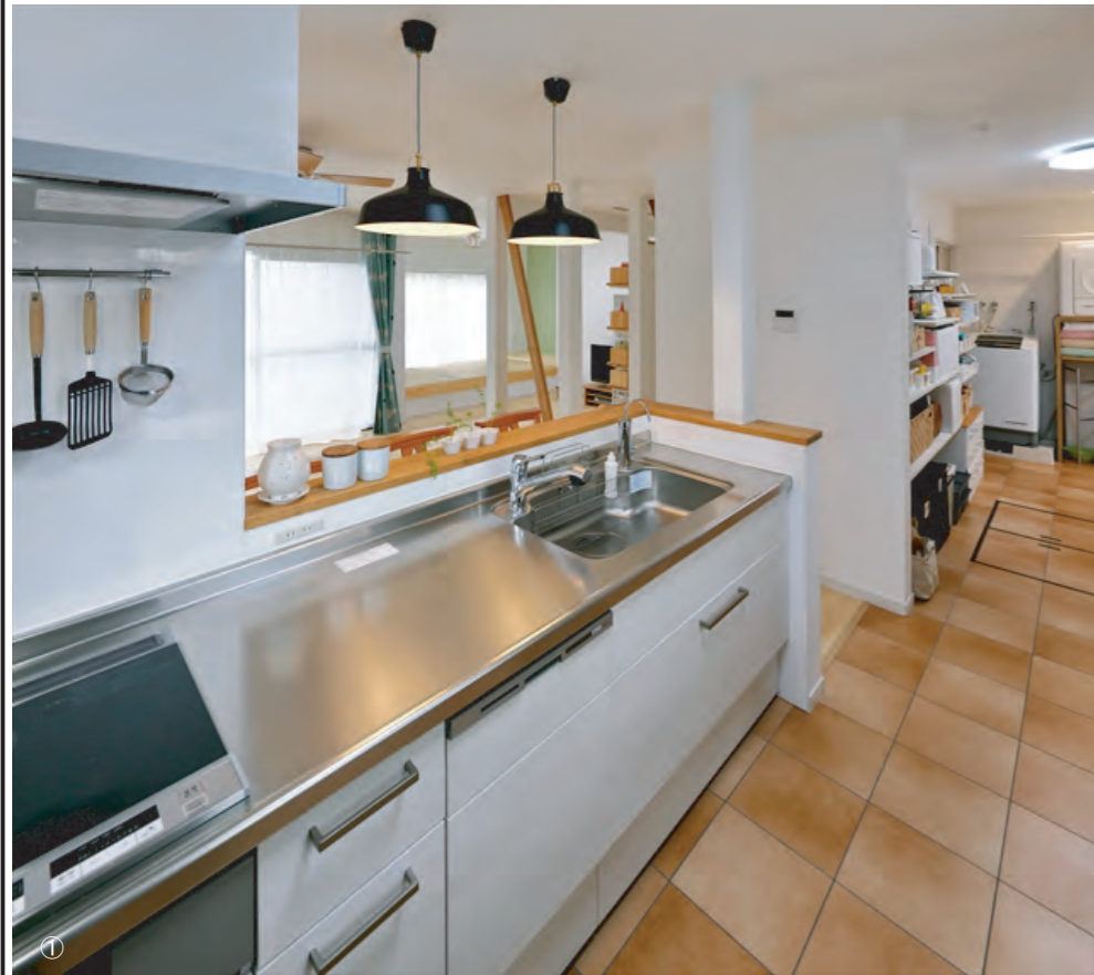
リフォーム前後の写真