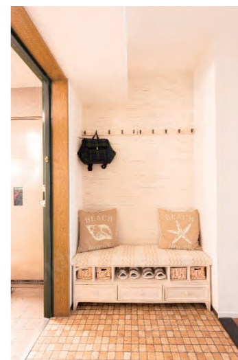
④玄関収納を取り払いニッチなゆどりのコーナーへ。