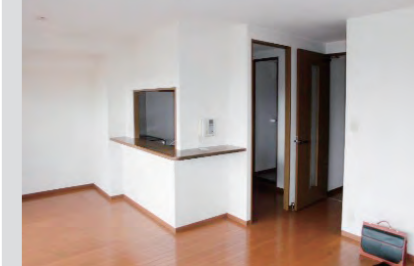
①セミクローズのキッチン