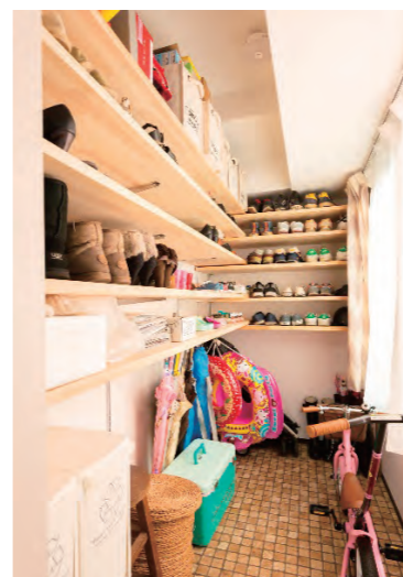
③玄関とつながるシュクロークは自転車も入る大容量のスペース。