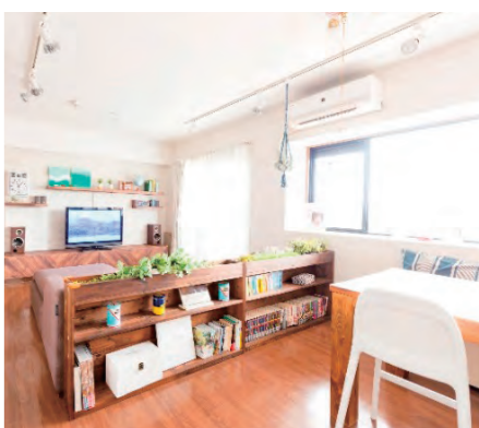
⑤TVボードや家具など夫婦でリメイクを楽しくて製作