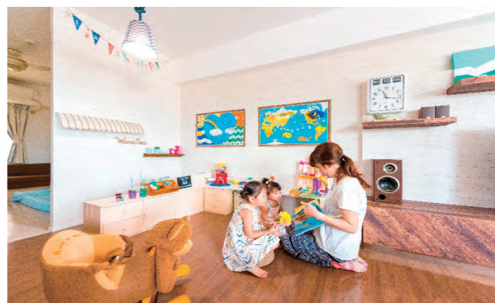
②LDKとつながるおもちゃコーナー、奥は寝室。おまごどとコーナーのミニキッチン壁から出ているテントの屋根はママのお手製。