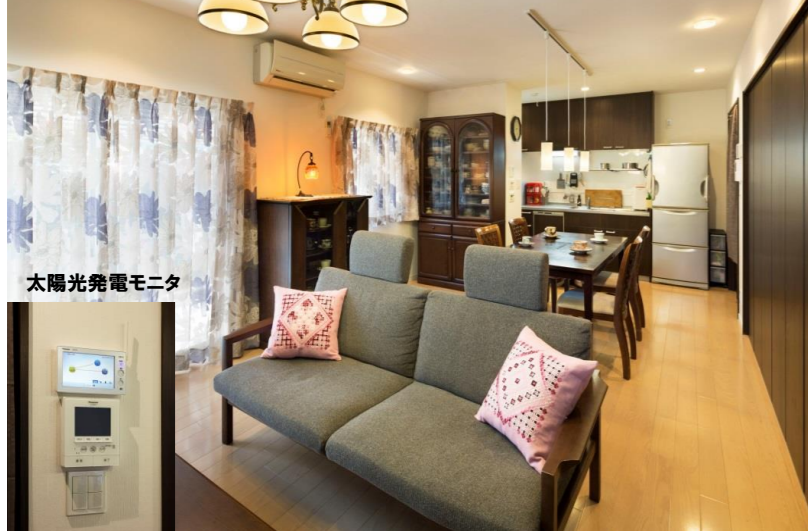
太陽光発電モニター