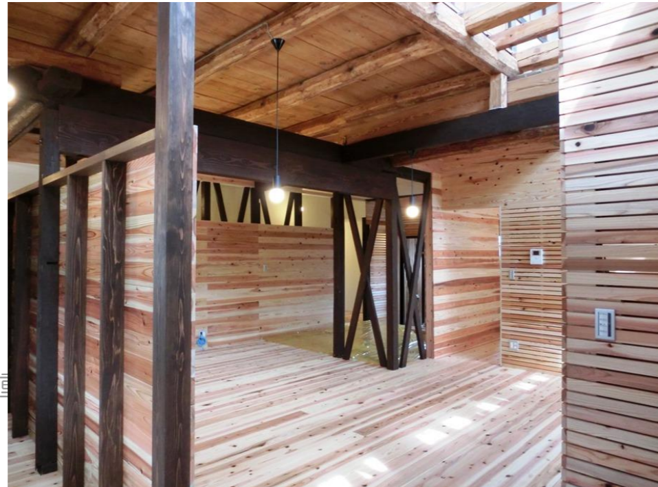
③ダイニングからリビング