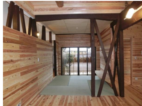
②リビングから坪庭