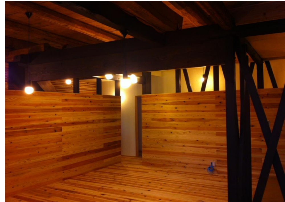
④リビングから廊下