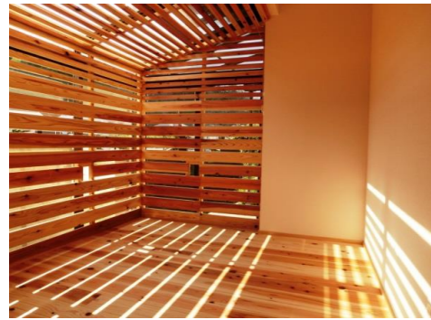
⑥ウォークインクローゼット