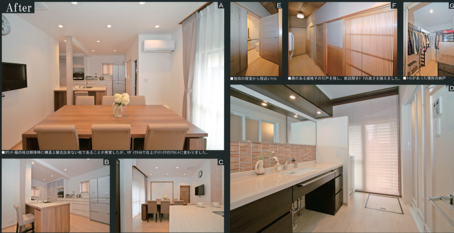
■かつて脇の柱は解体時に構造上撤去出来ない柱であることが発覚したが、モイタイドで仕上げ行列のアクセントに変わりました。