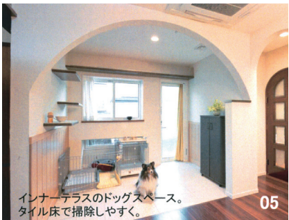
05 インナーテラスのドッグスペース。タイル床で掃除しやすく。