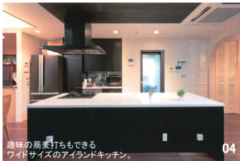
04 趣味の蕎麦打ちもできるワイドサイズのアイランドキッチン。