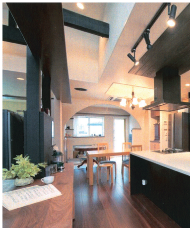
02 露出した柱や梁は、カウンターやキャットウォークを絡めてデザイン化した。