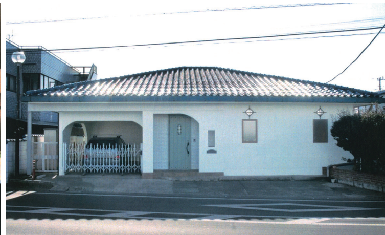
03 医院の外観を生かした。医院から住宅へと様変わり。