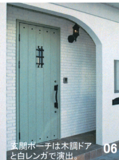
06 玄関ホーチは木調ドアと白レンガで演出。