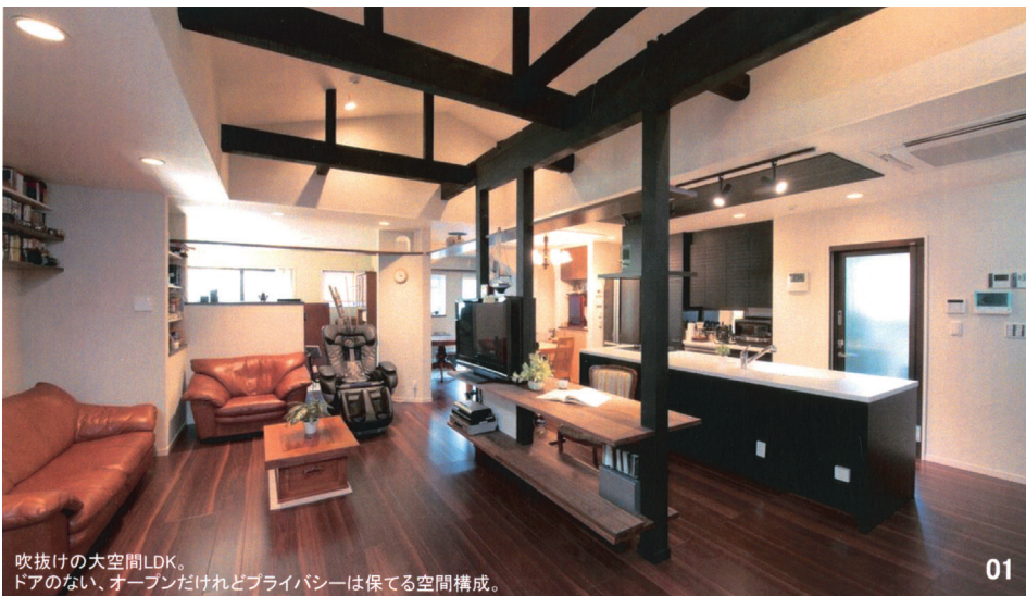
01 吹抜けの大空間LDK。ドアのない、オープンだけれどプライバシーは保てる空間構成。