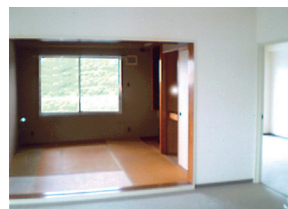
② 室内の隔に押し込められていたキッチンが、四季の景色を楽しみながら、のびのび料理ができる「ビューキッチン」に大変身。カウンター越しに家族との会話もはずみます。