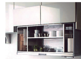
上部吊戸棚は、ワンタッチで自動昇降し、使いやすい位置で出し入れできる、食器乾燥庫タイプのオートムブシステム。洗った食器をスッキリ収納。除菌乾燥タイプなので、ふきんやまな板も清潔に除菌できます。