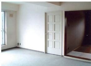
① 旧洋室とリビングを一体化に見せるため、下り壁を窓面に設け、カーテンBOXとした。