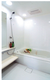
◀従来の1216サイズから1417サイズのゆったり大型タイプに変更。