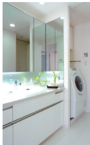
◀ワイドミラーを中央に配した3面鏡タイプ、ミラー裏側には収納棚を確保。