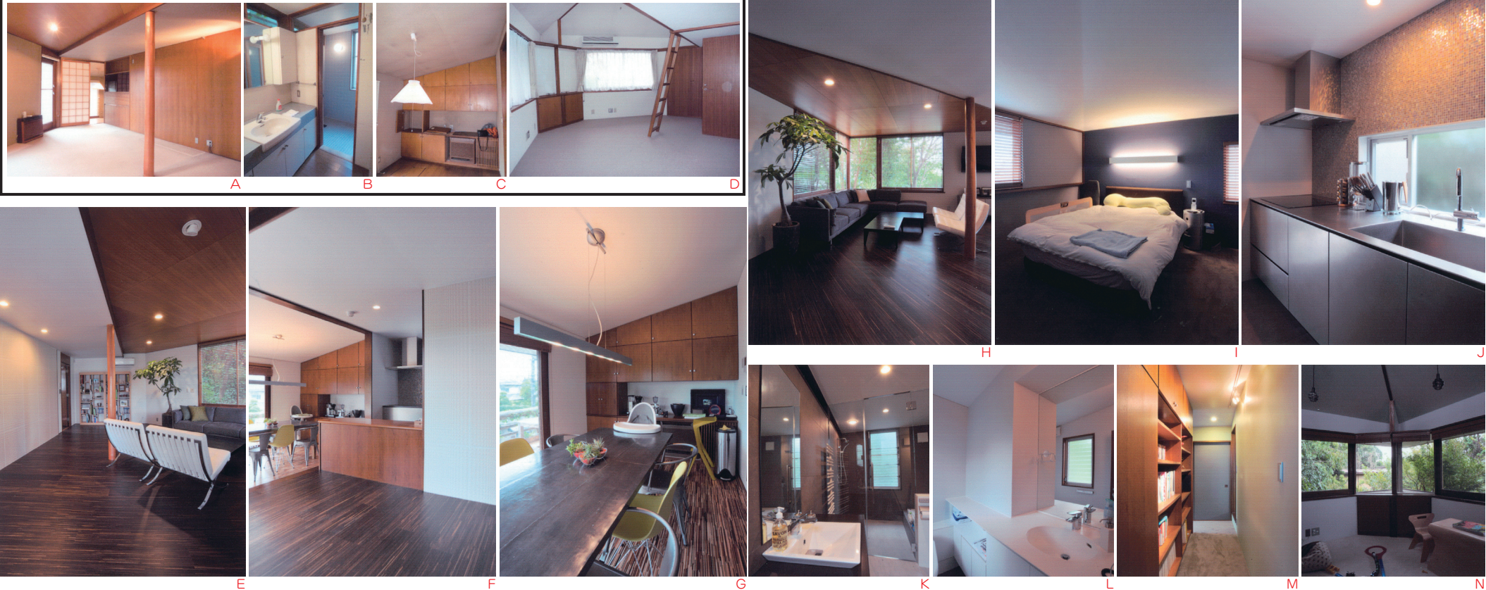
リフォーム前後の写真

旧持主から既存建築を壊さず住み継ぐ条件で譲渡された。台所の仕切りをはずしてLDKに広がりを持たせた以外は間取りを変えず、若い住人に合わせ、床、壁を硬くハードな材料で一新し、スタイリッシュな空間に生まれ変わった。