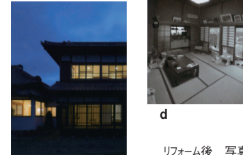
リフォーム後