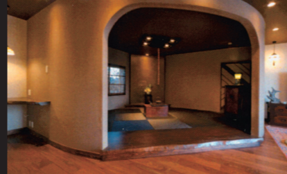
④：かまくらをイメージしアール状の塗り壁で囲った畳コーナー