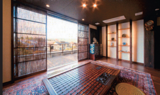
①：眺望が楽しめるくつろぎの間