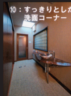
⑩：すっきりとした洗面コーナー