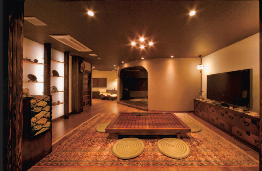
②：東北の囲炉裏端をイメージした極上のおもてなし空間