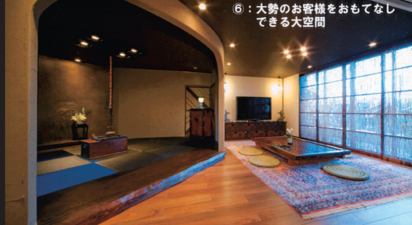
⑥：大勢のお客様をおもてなしできる大空間