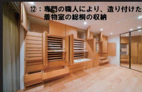
⑫：専門の職人により、造り付けた着物室の総桐の収納