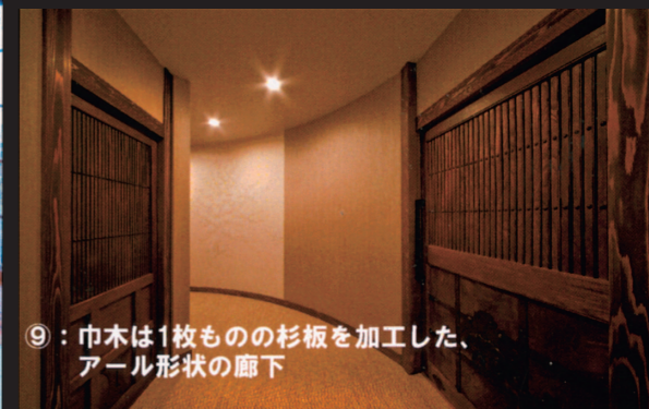
⑨：巾木は1枚ものの杉板を加工した、アール形状の廊下