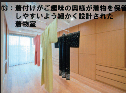
⑬：着付けがご趣味の奥様が着物を保管しやすいよう細かく設計された着物室