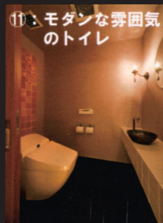
⑪：モダンな雰囲気トイレ