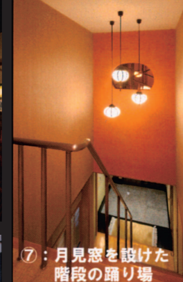
⑦：月見窓を設けた階段の踊り場