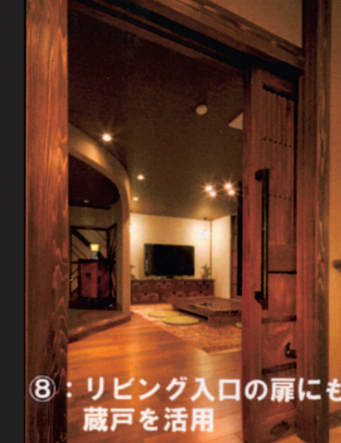
⑧：リビング入口の扉にも蔵戸を活用