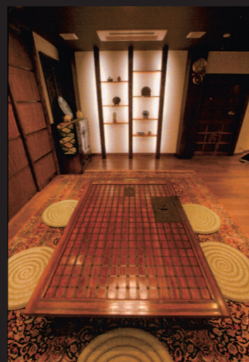
③：骨董品や蔵戸を活用したテーブルが映える空間