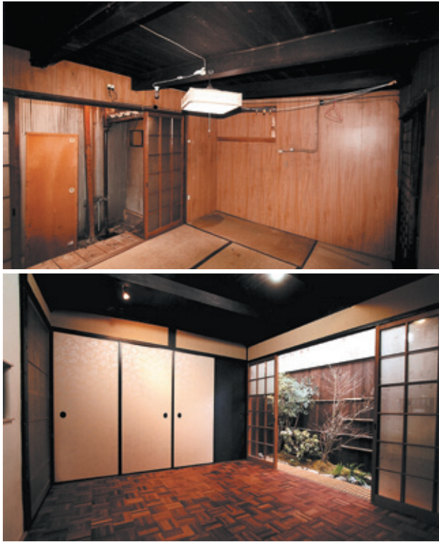
リフォーム前後の写真

町屋リフォームを上手に現代風かつコンパクトに仕上げた好例。築130年の長屋を、床や壁、襖などの素材や使用する家具まで含めて、京都らしさを十分に残しながら再生している。コストも抑えられていて、参考に出来る点が多い。