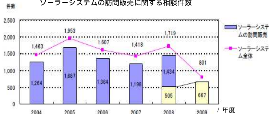
全国の消費生活センターに寄せられた ソーラーシステムの訪問販売に関する相談件数

08年度と09年度の白い棒グラフは9月15日までの件数